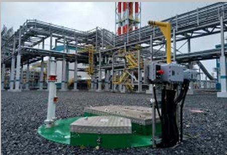
Производство и поставка 30-и комплектных КНС ПАО "СИБУР Холдинг" Западно- Сибирский Нефтехимический комбинат Г. Тобольск